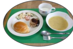
ミートローフ・ポタージュスープ マセドアンサラダでクリスマスパーティをしました。