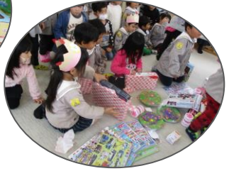
「やった～これであそびたい!」「かわいいねえ」など大興奮です。