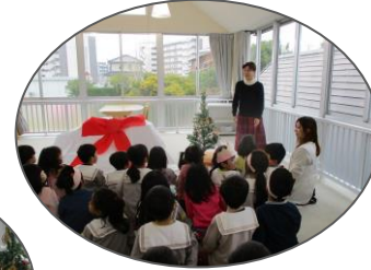
サンタさんからプレゼントがたくさん届きました。