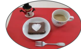
グラウニーケーキとミルクティのおやつで、みんな一緒に「メリークリスマス」